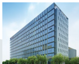
益新(中国)有限公司

今後さらに海外拠点の拡充と事業基盤の強化を進め、お客様の海外事業展開を一層強力にサポートしていきます。