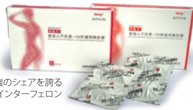
中国で5割強のシェアを誇る インターフェロン